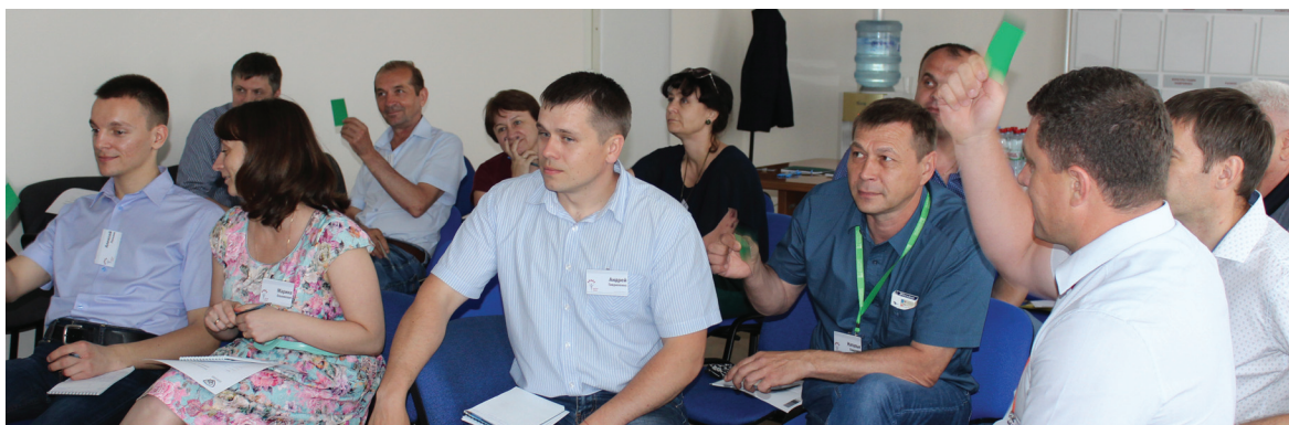
Зеленый свет промышленной безопасности - руководители предприятий в процессе тренинга

— Безусловно, знание правил — это основа, но кроме знаний необходимо их осознанное применение. Осознанное — значит, что мы не только действуем по инструкции, но и понимаем все риски небезопасного поведения. Это когда пристегнутый ремень в автомобиле у пассажира не для того, чтобы не пилсало, пока не пристегнешься, и не для того, чтобы избежать штрафа ГИБДД, а для того, чтобы снизить риск или тяжесть травмы, если, не дай Бог, случится ДТП. Вы сами знаете, сколько у нас произо-